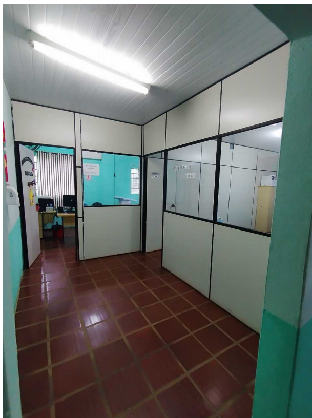
Foto 04: Sala de atendimento atualmente utilizada pela Assistente Social e para o serviço de Cadastro Único (CadÚnico). O ambiente será readequado para comportar o uso como sala de atividades coletivas, permitindo reuniões e atividades de orientação em grupo.