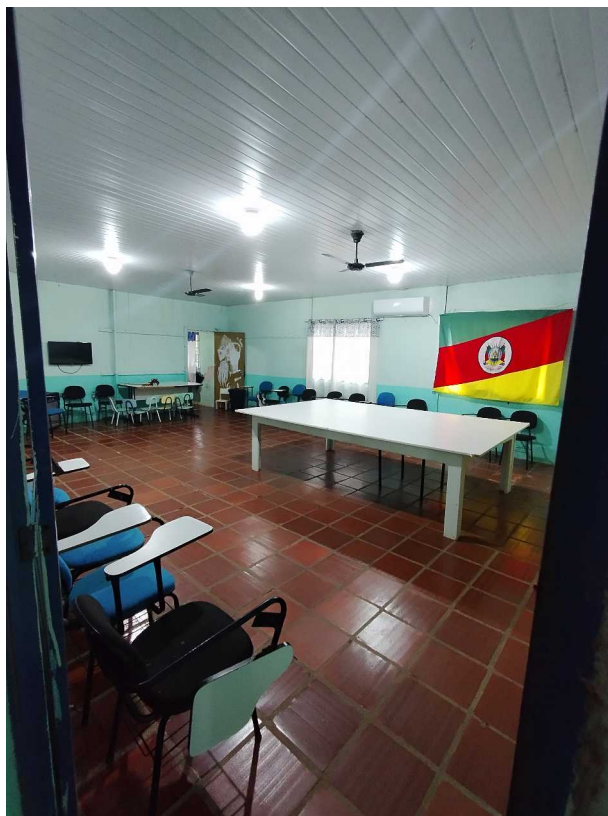
Foto 06: Sala atualmente destinada a atividades coletivas. O espaço será redistribuído em três salas independentes, destinadas a atendimentos individuais, de modo a garantir privacidade e adequação funcional.