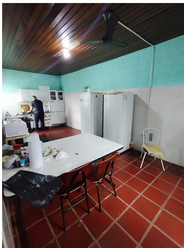
Foto 05: Cozinha existente, que será readequada para garantir melhores condições de uso,