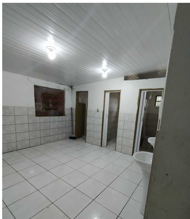
Foto 07: Banheiro existente. O local será reformulado para a implantação de dois banheiros acessíveis (PNE) e um banheiro com fraldário, atendendo às normas de acessibilidade universal (ABNT NBR 9050).