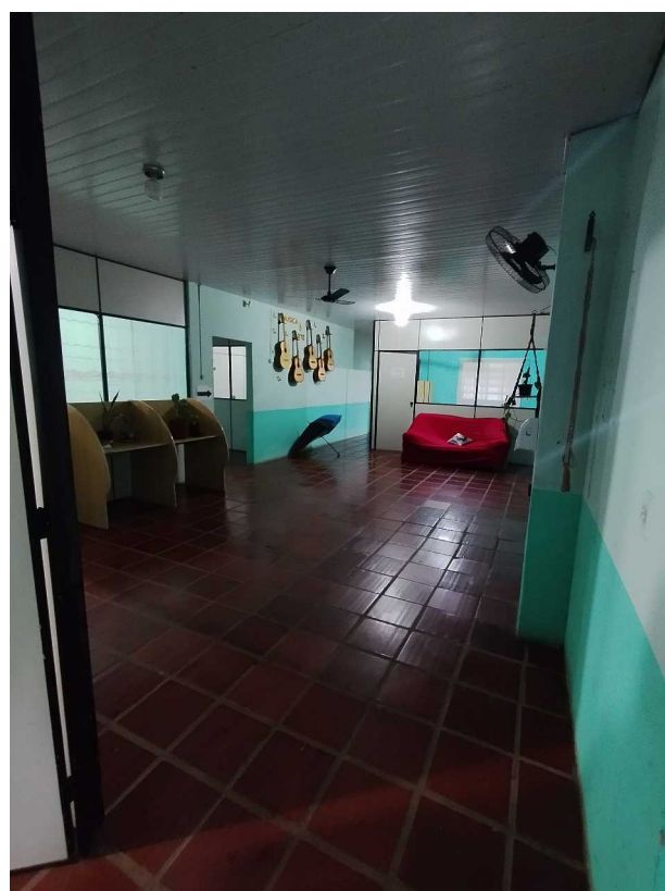
Foto 03: Espaço hoje destinado apenas à circulação interna. Será reconfigurado para implantação da sala de espera.