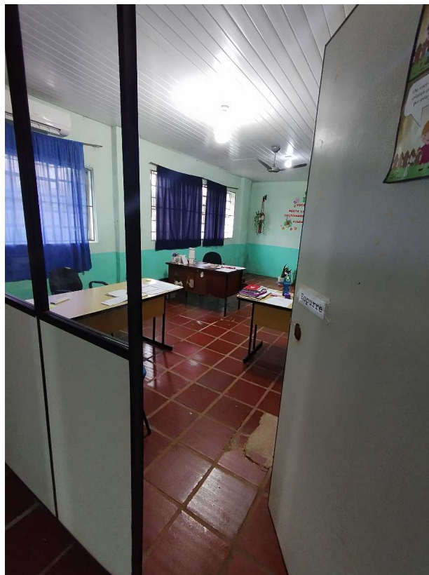
Foto 02: Área de recepção, onde será realizado o reordenamento do mobiliário e a adequação do espaço para melhor fluxo de atendimento, com a troca dos pisos danificados.